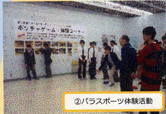
②パラスポーツ体験活動