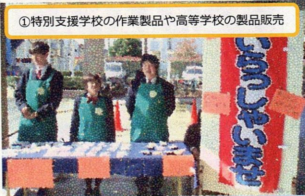
①特別支援学校の作業製品や高等学校の製品販売