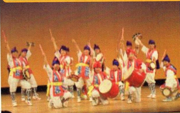
③特別支援学校の児童・生徒と高等学校等の生徒による共同舞台発表